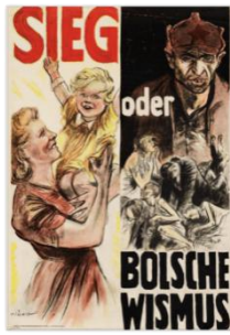
Антибольшевистский пропагандистский плакат, 1943 г. 9