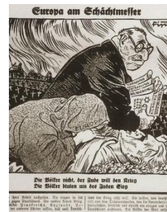
Фрагмент обложки немецкого еженедельника «Штурмовик», 1934 г. 11