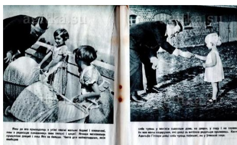
Рис. 9. Фрагмент брошюры для населения СССР с текстом: «У Гитлера дети чувствуют себя, как дома. От его ласкового взгляда у них проходит всякое смущение. Они доверчиво показывают ему свои игрушки и куклы» 22 .

Отдел «Восток» Министерства пропаганды предпринимал попытки реабилитировать образ Гитлера и солдат Третьего Рейха, окружая их счастливыми детьми на различных изображениях, используя тем самым эффект ореола: человек, которому доверяют дети, не может быть плохим.