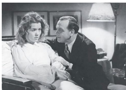
Рис. 2. Кадр из фильма «Я обвиняю». Режиссер Вольфганг Либенайнер

3. «Я обвиняю» 1941 г. – пропагандистский фильм, где мужчина, убивший страдающую рассеянным склерозом жену, на суде выдвигает аргументы, что продление жизни иногда противоречит природе. В фильме звучат теоретические рассуждения, использовавшиеся нацистами для обоснования и оправдания этого способа умерщвления больных. Фильм был снят с целью популяризации программы «Операция Т4» – евгеническая программа немецких нацистов по стерилизации, а в дальнейшем и физическому уничтожению людей с психическими расстройствами, умственно отсталых и наследственно отягощённых больных.