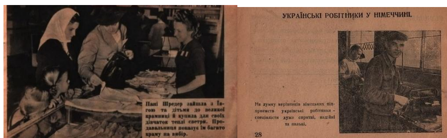
Рис. 7 и 8. Фрагменты брошюры, рассказывающих о «райских» условиях жизни украинок и украинцев, уехавших работать в Германию 21 .

Отдел «Восток» Министерства пропаганды предпринимал попытки реабилитировать образ Гитлера и солдат Третьего Рейха, окружая их счастливыми детьми на различных изображениях, используя тем самым эффект ореола: человек, которому доверяют дети, не может быть плохим.