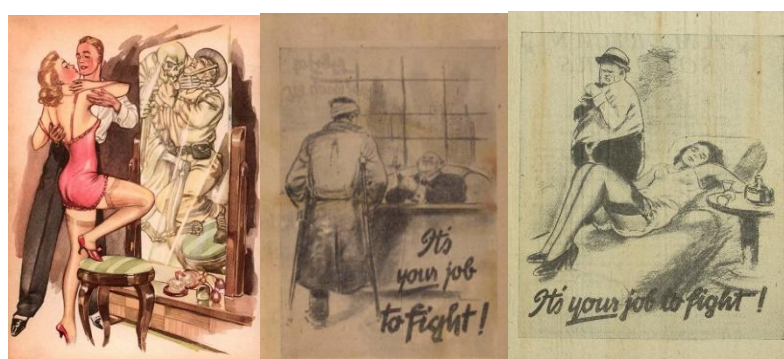
Рис. 10. Пропагандистские листовки, направленные на американских солдат с текстом: «Твоя работа – сражаться!» 26

В пропаганде, направленной на войска союзников Антигитлеровской коалиции, преимущественно на американских и английских солдат, эксплуатировался сексуальный мотив, чаще всего указывая на то, что пока они воюют на фронте, кто-то другой развлекается с их женщинами. Также авторы часто обращаются к противопоставлению чиновников и предпринимателей США и Великобритании, которые, в отличие от рядовых граждан, якобы не воюют и добиваются успеха. Такие материалы также основаны на приеме противопоставления.