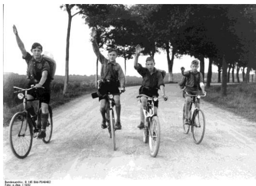
Рис. 3. Члены Гитлерюгенда отдают честь нацистской партии на велосипедах, недалеко от Берлина, Германия, 1932 г. 16

Начиная с 1939 г. членство в этой организации стало обязательным для всех мальчиков и девочек в возрасте от десяти до восемнадцати лет, согласно Закону о «Гитлерюгенде» (Gesetz über die Hitlerjugend):