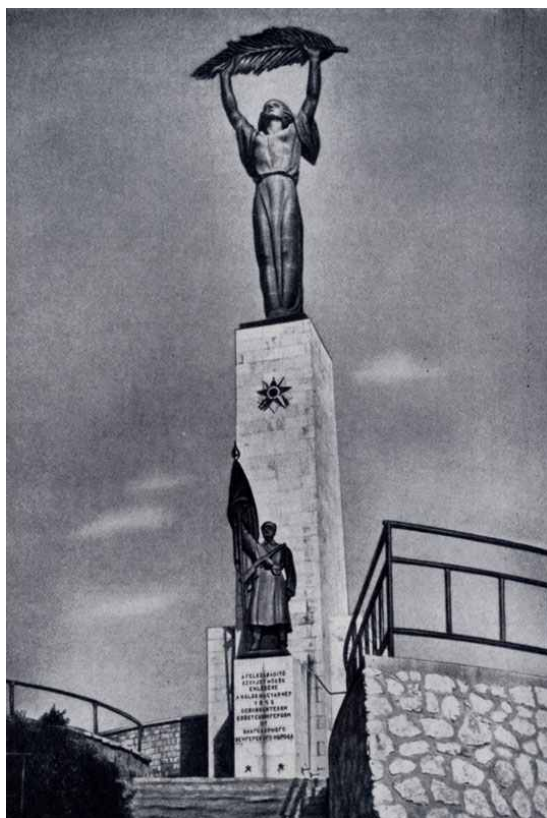
Первоначальный вид памятника

В годы Второй мировой войны венгерское правительство М. Хорти 27 июня 1941 г. объявило войну Советскому Союзу. Завершение Белградской операции создало возможность для удара 3-го Украинского фронта на север вдоль Дуная, на будапештском направлении. Также было спланировано развитие наступления в центральной части Венгрии и Юго-Восточной Словакии. На территории Венгрии было осуществлено три операции: Дебреценская, Будапештская и Балатонская. Данные операции проводились 2-м и 3-м Украинскими фронтами в конце 1944 – начале 1945 г. Будапешт был освобожден 13 февраля 1945 г. В результате было обеспечено поражение немецко-фашистской группы армий «Юг», освобождение Будапешта и вывод Венгрии из войны на стороне фашистской Германии 13 .